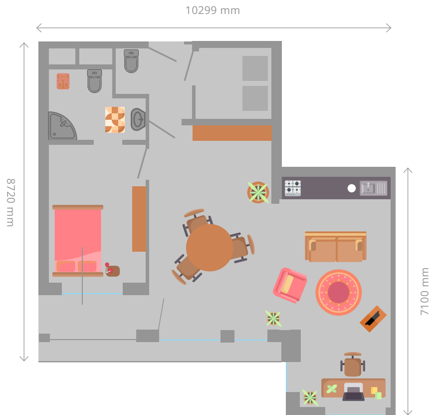
Appartement: 78m 2